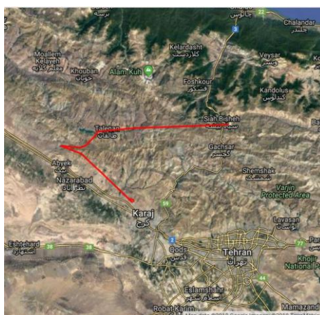
شکل ۱- محدوده جغرافیایی و مکان‌های نمونه‌گیری شده در نقشه که توسط وب‌سایت www.gpsvisualizer.com تهیه شد. نقاط نمونه‌گیری شده با خط قرمز به یکدیگر متصل شدند.

نمونه‌گیری در خرداد ماه ۱۳۹۶ در سه مرحله انجام گرفت. به‌منظور جداسازی گرهک‌ها از ریشه لگوم‌های غیر زراعی، ۲۱ نمونه لگوم از ۱۲ مکان در سه شهرستان استان البرز جمع‌آوری شد (جدول ۱ و شکل ۱). بر روی ریشه چندین نمونه گرهک‌ها به‌وضوح مشهود بودند و در چندین نمونه گرهک‌ها به‌وضوح دیده نمی‌شدند. در نتیجه به‌منظور جداسازی باکتری، هم از خاک و هم از گرهک‌های روی ریشه استفاده شد. به این ترتیب