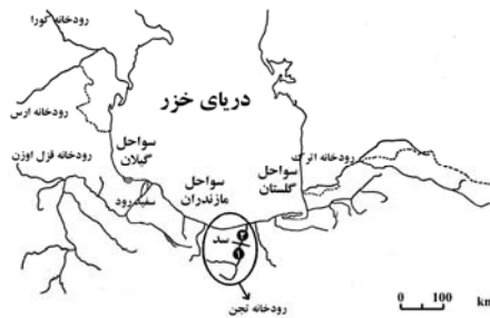
شکل ۱- موقعیت مکان‌های نمونه‌گیری در بالا دست (۱) و پایین دست (۲) سد شهید رجایی در رود تجن (برگرفته شده از Samaei et al. 2009)

استخراج DNA - استخراج DNA با استفاده از روش کیلاکس ۳ (Estoup et al. 1996) صورت پذیرفت. در این روش نمونه‌ای با اندازه ۲×۲ میلی متر از بافت باله را در یک میکروتیوپ ۱/۵ میلی‌لیتری استریل انداخته و مقدار ۵۰۰ میکرولیتر محلول Chelex ۱۰ درصد به آن اضافه شد. در مرحله بعد مقدار ۱۵ میکرولیتر آنزیم پروتئیناز K (100 U/ml) به نمونه افزوده و جهت فعال نمودن کامل آنزیم پروتئیناز K، میکروتیوپ‌های حاوی نمونه به مدت یک ساعت در بن ماری شیکردار در دمای ۵۶ درجه سانتی-گراد قرار داده شدند و پس از آن، میکروتیوپ‌ها به مدت ۱۵ دقیقه در آب با دمای ۱۰۰ درجه سانتی‌گراد، بر روی حرارت جوشانیده شدند. هر بار قبل از استفاده نیز میکروتیوپ‌ها را پس از یک ورتکس ساده (LMS)، به مدت ۱۵-۱۰ ثانیه با دور rpm ۶۰۰۰ سانترفیوژ شدند. برای تعیین کمیت و خلوص DNA از دستگاه اسپکتروفتومتر با نور UV (با استفاده از طول موج‌های ۲۶۰ و ۲۸۰ نانومتر) و مشاهده نوارهای DNA بر روی ژل آگارز ۰/۸ درصد (۰/۳۲ گرم آگارز جامد در ۴۰ سی سی بافر TAE) و مقایسه آن با فاژ لامبدا استفاده گردید (Estoup et al. 1996). واکنش زنجیره‌ای پلیمرز (PCR) - DNA استخراج شده با استفاده از آغازگرهای RAPD جهت تعیین چند شکلی مورد ارزیابی قرار گرفت. این آغازگرها به سفارش شرکت سینا ژن تهیه شدند. برای تعیین شرایط بهینه PCR ابتدا DNA با مقادیر متغیر از مواد مورد استفاده و در دماهای اتصال مختلف مورد تکثیر قرار گرفتند تا بهترین شرایط انتخاب گردد. از بین ۱۰ آغازگر، تعداد ۶ آغازگر که دارای تکرارپذیری بالاتر، بهترین شرایط تکثیر و بیشترین میزان پلی مورفیسم را داشتند انتخاب گشتند (جدول ۲).