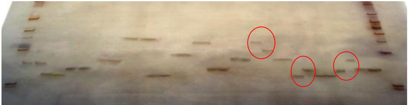
شکل ۴- الگوی نوار بندی متفاوت نشانگرهای دارای بیشترین چندشکلی بر روی بالک های مقاوم و حساس به (BR.PVY) بالک مقاوم و (BS) بالک حساس. نشانگرهای دارای چندشکلی با دایره مشخص شده‌اند.

بلاست برنج پیوستگی دارد، همچنین مشخص شد که یک ژن جدید غالب به نام ژن Xa33(t) مقاومت به بیماری بلاست را در کولتیبوار Ba7 برنج ایجاد می‌کند (Yang et al. 2009). Shi et al. (2011)، با استفاده از روش MAS، از تعدادی نشانگرهای مولکولی مبتنی بر PCR برای شناسایی ژن مقاومت به ویروس لکه حلقوی گوجه فرنگی (TSWV)، ژن SW-5 استفاده کردند. در این تحقیق، یک نشانگر SNP اختصاصی برای ژن مقاومت به بیماری TSWV (ژن SW5-b ) در ژرم پلاسماهای مختلف گوجه فرنگی شناسایی شد (Shi et al. 2011). Ying et al. (2006)، با استفاده از روش MAS به بررسی و شناسایی نشانگرهای مولکولی برای مقاومت به بیماری زنگ برگ در گندم پرداختند. این نشانگرهای شناسایی شده می‌توانند برای اصلاح و بهبود مقاومت به این بیماری در برنامه‌های اصلاحی گندم از طریق روش MAS استفاده شوند (Ying et al. 2007). در پژوهشی، مکان یابی مولکولی ژن مقاومت به بیماری PVY (ژن Rysto ) در سیب زمینی بررسی شد. نتایج این پژوهش نشان داد که ژن Rysto یک ژن غالب است که مقاومت به بیماری PVY را در سیب زمینی ایجاد می‌کند (Brigenti et al. 1998). در تحقیقی که Rodal and Xiong (2008) انجام دادند، بیان کردند که توتون رقم VAM و رقم NC745 حامل ژن Va هستند که این ژن باعث ایجاد مقاومت توتون VAM نسبت به بیماری PVY می‌