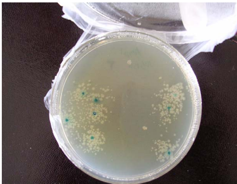
شکل ۱- باکتری‌های تکثیر شده بر روی محیط کشت (کلنی‌های آبی نمایانگر باکتری‌های فاقد قطعه ۱۶۳ bp و کلنی‌های سفید نمایانگر باکتری‌های حاوی قطعه ۱۶۳ bp می‌باشد)