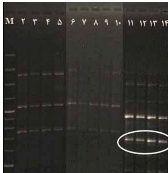
شکل ۳- الگوی باندهای آغازگر ISSR5 جمعیت توده یک (اینجه‌برون (برداشت ۹۰)) و توده هشت (جزیره آشورآده). (لاین ۲ تا ۱۰ توده یک، لاین ۱۱ تا ۱۴ توده هشت).

بدین طریق توانسته خود را از دیگر آغازگرها متمایز کند. علاوه بر این، در میان توده‌های مورد مطالعه، توده جمع‌آوری شده از جزیره آشورآده با توجه به داشتن بیشترین فاصله ژنتیکی، بر اساس ماتریس فاصله ژنتیکی نئی، و قرار گرفتن در گروهی مجزا بر اساس تجزیه کلاستر که منطبق با فاصله و شرایط جغرافیایی آن می‌باشد، به عنوان با ارزش‌ترین توده قلمداد می‌شود. با توجه به تجزیه کلاستر به دست آمده منطبق با مکان جغرافیایی توده‌ها و تمایزگذاری بین توده‌ها از لحاظ ژنتیکی، به کارایی و کارآمد بودن