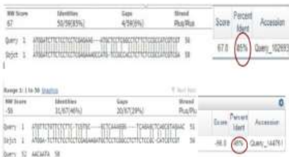
شکل ۴- BLAST توالی بین آغازگر TR3 و ابتدای ۵' ژن C4H در برابر توالیهای قطعات تکثیری با ترکیب آغازگری TR3-AD2 (بالا) و TR3-AD1 (پایین)

اختصاصی بودن آغازگرهای تصادفی و تکثیر بیش از حد محصول است. برای رفع این مشکل و حذف اسمیر، تعداد آغازگرهای تصادفی افزایش داده شد و دمای اتصال آغازگر چرخه‌های TAIL-PCR افزایش یافت. ترکیب سه نوع آغازگر اختصاصی به همراه شش نوع آغازگر تصادفی (مجموعاً ۱۸ نوع ترکیب آغازگری) باعث تولید باندهای متعددی در چرخه‌های PCR شد که مشاهده باند حاصل از واکنش اول (TR1) به همراه آغازگرهای تصادفی) به دلیل میزان تکثیر پایین محسوس نبود. آغازگرهای اختصاصی TR2 و TR3 با فاصله ۴۵ نوکلئوتیدی از هم روی توالی ژن طراحی شده بودند و از بین ترکیبات آغازگری مورد استفاده برای TAIL-PCR، محصولات حاصل از ترکیب آغازگری TR2 و TR3 با آغازگرهای غیراختصاصی AD1 و AD2 نشان‌دهنده این فاصله بودند (شکل ۱). در واقع این تفاوت ۴۵ جفت نوکلئوتیدی مشاهده شده بین باندهای حاصل از ترکیبات آغازگری مذکور نشانگر تکثیر احتمالی پرموتر مورد نظر بود بنابراین دو باند مربوط به ترکیبات آغازگری TR3-AD1 و TR3-AD2 توالی‌یابی شد (شکل ۲ و ۳).