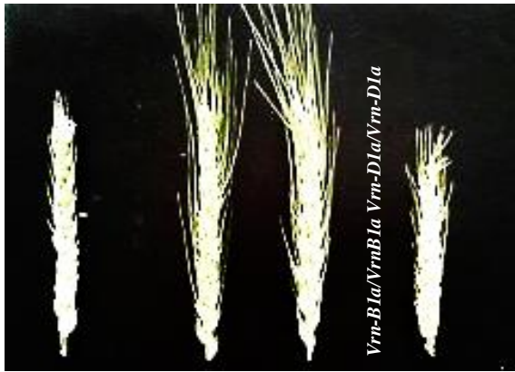
شکل ۲- مورفولوژی خوشه چهار لاین ایزوژن برای دو مکان ژنی Vrn-B1 و Vrn-D1

با توجه به نتایج مشاهده شده هر دو دلیل ژنتیکی مطرح شده می‌توانند این پدیده را توجیه نمایند. برای یافتن پاسخ این پرسش علاوه بر ارقام روشن و اکسکلیر، ارقام رخشان، شاه‌پسند، مهدوی و کل‌حیدری نیز مورد ارزیابی قرار گرفتند. به جز رقم روشن، سایر ارقام ریشک‌دار هستند. نتایج ارزیابی ژنتیکی نشان داد ارقام ریشک‌دار شاه‌پسند، مهدوی و کل‌حیدری دارای ژنوتیپ Vrn-D1a/Vrn-D1a و رقم ریشک‌دار رخشان دارای ژنوتیپ Vrn-B1a/Vrn-B1a است (شکل ۳). از این رو فرضیه پلیوتروپی رد می‌شود.