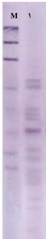
شکل ۳- هضم آنزیمی با AluI و هیبریداسیون با پروب PGRS (M) سایز مارکر شماره ۳ ریش آلمان ستون ۱) نمونه مورد بررسی

۲۳۱۳۰ bp ۹۴۱۶ bp ۶۵۵۷ bp ۴۳۶۱ bp ۲۳۲۲ bp ۲۰۲۷ bp