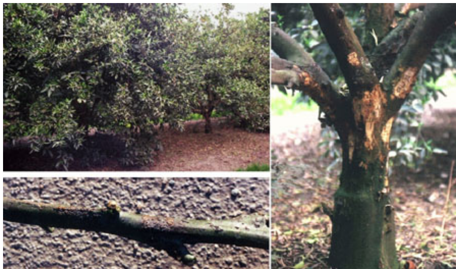
شکل ۳- علائم پوسته پوسته شدن شاخه (پرتقال روی پایه نارنج)