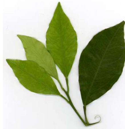
شکل ۱- علائم نقش برگ بلوطی روی پهنک برگ (پرتقال روی پایه نارنج)