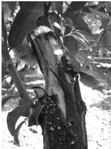
شکل ۲- علائم پوسته پوسته شدن تنه (پرتقال روی پایه نارنج)

عبارت از علائم نقش برگ بلوطی روی پهنک برگ و نقوش ایجاد شده روی برگ‌های جوان (شکل ۱)، پوسته پوسته شدن تنه اصلی (شکل ۲) و شاخه‌ها (شکل ۳) بود. از درختان دارای آلودگی عکس‌برداری شد و مناطق دارای درختان آلوده مشخص گردید، تا جهت ردیابی‌های سرولوژیکی و مولکولی آزمایشات تکمیلی در مورد آنها انجام پذیرد.