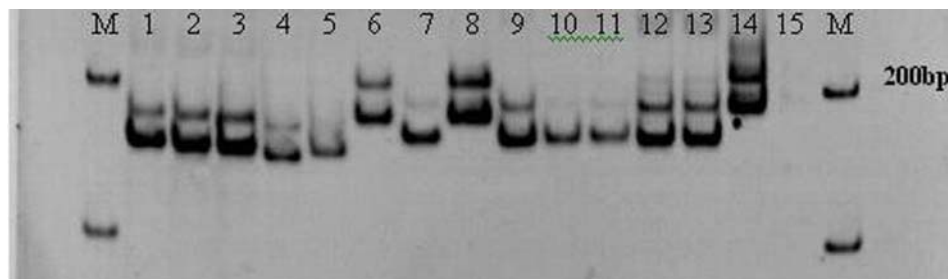
شکل ۲- نمونه ژل پلی اکریل آمید ۶ درصد با استفاده از نشانگر QAAT074 نمونه‌ها به ترتیب از ۱ تا ۱۴ مربوط به مورفوتیپ‌های 881014، 881013، 881021، 881022، 881031، 881032، 881041، 881043، 881056، 881057، شماره ۱۵ کنترل منفی و M نشانگر وزنی در ابتدا و انتهای ژل بودند.

نشانگرهای ریزماهواره مورد تایید قرار گرفت. البته در گروه‌بندی خوشه‌ای بعضی از مورفوتیپ‌ها تفاوت چندانی نداشتند که نمونه‌های ۴۲ و ۴۳ از این نوع ژنوتیپ‌ها هستند و آن دو با نمونه ۳۶ نیز تفاوت کمی داشتند. در گروه‌بندی به مختصات اصلی شباهت زیاد بین دو مورفوتیپ ۴، ۸ و همچنین مورفوتیپ‌های ۳۲، ۳۴ و ۴۰ در گروه A وجود داشت (شکل ۳). در چنین حالتی بررسی آنها و تعیین مورفوتیپ‌های مشابه در هر دو روش گروه‌بندی برای حذف نمونه‌های مشابه با توجه به صفات مورفولوژیک و