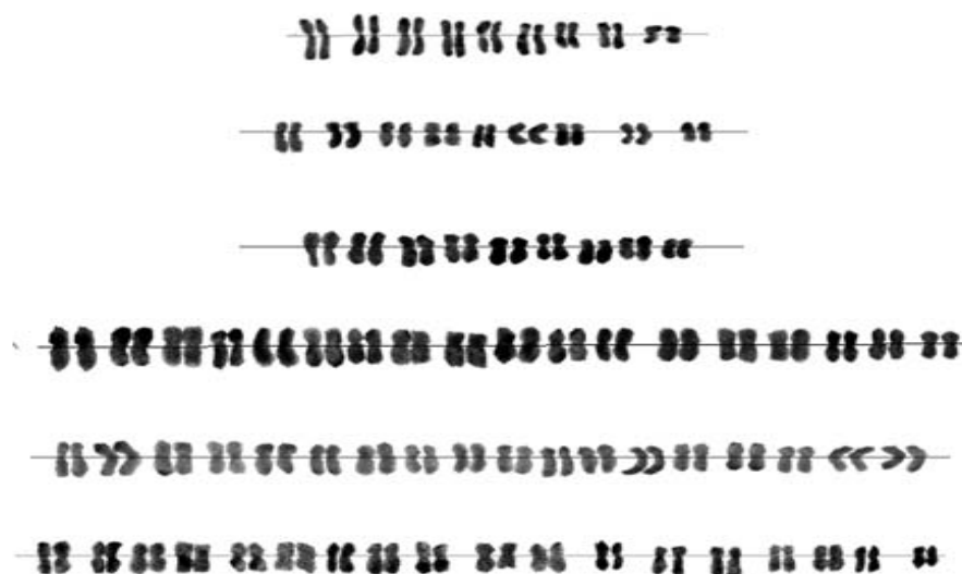
شکل ۲- کاریوگرام شش اکوتیپ بومادران (به ترتیب از بالا به پایین: الیگودرز، اردبیل، مشکین شهر، اراک، ایلام و استهبان)

اکوتیپ مشکین شهر دارای 2n=2x=18 کروموزوم بود. طول بلندترین و کوتاهترین کروموزوم در این اکوتیپ 3/5 و 1/8 ؛ حداقل و حداکثر طول بازوی کوتاه 0/7 و 1/5 ؛ حداقل و حداکثر طول بازوی بلند 1/1 و 2 ؛ حداکثر و حداقل میزان نسبت بازوی کوتاه به بازوی بلند (S/L) 1 و 0/41 ؛ حداکثر و حداقل مقدار نسبت بازوی بلند به کوتاه (L/S) 2/43 و 1 ؛ حداکثر و حداقل شاخص اختلاف طول دو بازوی کروموزوم (d-value) 1 و صفر؛ بیشترین و کمترین طول نسبی کروموزوم (\%RL) 14/2 و 7/3 در صد میکرون و بالاترین و کمترین شاخص هازیوارا (\%F) 50 و 29/16 درصد تعیین شد.