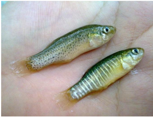
شکل ۱- ماهی گورخری زاگرس ( Aphanius vladykovi )

ریزماهوره‌ها یکی از مهم‌ترین نشانگرهای ژنتیکی به شمار می‌آیند، زیرا دارای پتانسیل تخمین مهاجرت و قدرت تفکیک برای تشخیص نسبت بالای خویشاوندی می‌باشند (Kimberly et al. 2006). از آن‌جا که برای یک جایگاه که آغازگر ریزماهوره بر اساس آن طراحی می‌شود، آلل‌های متعددی یافت می‌شود، این نشانگر برای بررسی تنوع ژنتیکی قابلیت بالایی دارد. پایداری ریزماهوره‌ها احتمالاً از طریق پایداری ژنوم در کلیه سطوح کنترل می‌شود، به طوری که برخی جهش‌ها نظیر جهش‌هایی که موجب