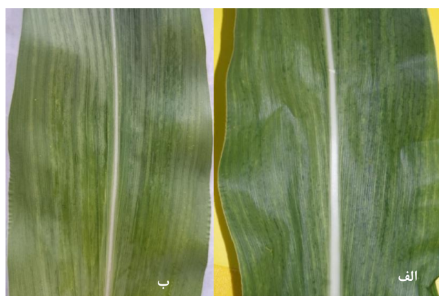
شکل ۱- الف و ب: موزائیک شدید به صورت نواری در برگ‌های ذرت آلوده به IJMV

تراریخت شدند. DNA پلاسמידهای نوترکیب پس از استخراج با Qiagen Plasmid Miniprep Kit (شرکت کیاژن، آلمان) توالی‌یابی شدند (شرکت ماکروژن، کره جنوبی) و تعیین ترادف با استفاده از آغازگرهای عمومی M13 انجام شد. براساس آزمون الایزا از ۹۰ نمونه جمع‌آوری شده، ۷۲ نمونه (۸۰ درصد) آلوده به IJMV بودند. طبق نتایج این تحقیق تمام مناطق مورد بررسی آلوده به IJMV تشخیص داده شدند و آلودگی مزارع ذرت بابلسر به IJMV نسبت به دیگر مناطق خیلی بیش‌تر بود (۸۱ درصد). عمده‌ترین علائم مشاهده شده موزائیک شدید و خفیف به صورت نواری بود (شکل ۱، الف و ب). واکنش RT-PCR که با استفاده از یک جفت آغازگر دژنره از ژن CI انجام شد، منجر به تکثیر