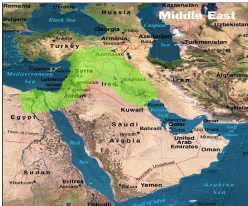
شکل ۲- حوزه هلال حاصلخیز و موقعیت ایران در این منطقه. نواحی مشخص شده با رنگ سبز بیانگر حوزه هلال حاصلخیز می‌باشد.

شکل ۱- رابطه فیلوژنتیکی بین گونه‌های دیپلوئید، تتراپلوئید و هگزاپلوئید آژیلوپس و تریتیگوم بر اساس ساختار ژنوم هسته‌ای و سیتوپلاسمی آنها. ژنوم‌های نشان داده شده درون پرانتز بیانگر ژنوم هسته‌ای می‌باشند. ژنوم‌هایی که اصلاح شده‌اند زیر آنها خط کشیده شده‌است (اقتباس از (Tsunewaki (2009).