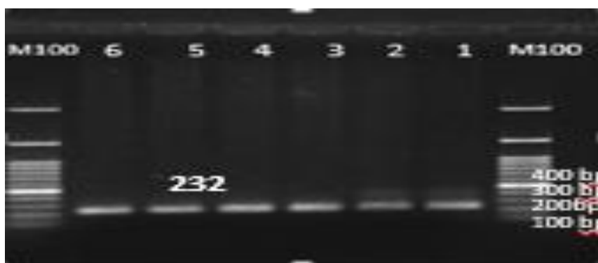
شکل ۱- نمونه‌ای از الکتروفوروز محصولات PCR روی ژل آگارز 1/5 درصد با استفاده نشانگر 100 bp ژنتیکی شرکت سینا ژن ایران

برگشت هر کدام ۰/۵ میکرولیتر، آب استریل ۱۳ میکرولیتر، و کیت HRM تهیه شده از شرکت زیست فناوری پیشگام با شماره ثبت (۰۸-۳۱-۰۰۰۰۱) به مقدار ۴ میکرولیتر توسط دستگاه Light 96 (Roch) انجام پذیرفت. شرایط بهینه برای انجام واکنش طبق پروتکل انجام گرفت سپس گروه‌بندی (بر اساس تفکیک نقطه ذوب) DNA توسط تجزیه و تحلیل HRM انجام شد. جهت تعیین توالی و حصول حجم مناسب از واکنش زنجیرهای پلیمرز برای توالی‌یابی، نمونه‌های منتخب مجدد تحت واکنش PCR قرار گرفته و پس از صحت انجام آن و عدم وجود آلودگی به شرکت زیست فناوری پیشگام ارسال شد. الکتروفوروز محصولات تکثیر شده نشان داد که قطعه مورد نظر ژن