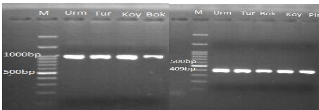
شکل ۱- قطعات تکثیر شده ژن های CYC-B (سمت راست) و PSY1 (سمت چپ) به ترتیب با اندازه های ۴۰۹ و ۱۰۰۰ جفت باز در ژنوتیپ های مختلف گوجه فرنگی (چاهک ها به ترتیب M: نشانگر 1Kb Fermentas، آلمان) ۱: ارومیه ۲: ترکیه ۳: بوکان ۴: خوی ۵: پیرانشهر (ژن CYC-B ) و ۱: ارومیه ۲: ترکیه ۳: خوی ۴: بوکان (ژن PSY1 )

ایران ارسال شد. با توجه به اینکه طول قطعه تکثیری در ژن PSY1 ۱۰۰۰ جفت باز بود برای قرائت کامل، توالی یابی با استفاده از هر دو آغازگر پیشرو و معکوس صورت گرفت ولی در ژن CYC-B با طول قطعه ۴۰۹ جفت بازی تنها از آغازگر پیشرو جهت توالی یابی استفاده شد. برای اطمینان از صحت قطعات توالی یابی شده، ابتدا توالی ها در برابر ژنوم گوجه فرنگی بلاست شد و نواحی مشترک توالی های پیشرو و معکوس هر قطعه شناسایی و توالی ها با استفاده از نرم افزار Fast PCR باز یابی شد. سپس هم ردیفی چندگانه بین توالی های مربوط به هر ژن توسط نرم افزار Clustal Omega جهت شناسایی SNP ها انجام گرفت.