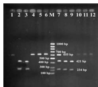
شکل ۲- الکتروفورز محصولات حاصل از هضم برای ژن IGFBP-3 توسط آنزیم XspI

جدول ۱- فراوانی‌های ژنوتیپی و ژنی برای جایگاه IGFBP-3 توسط آنزیم HaeIII