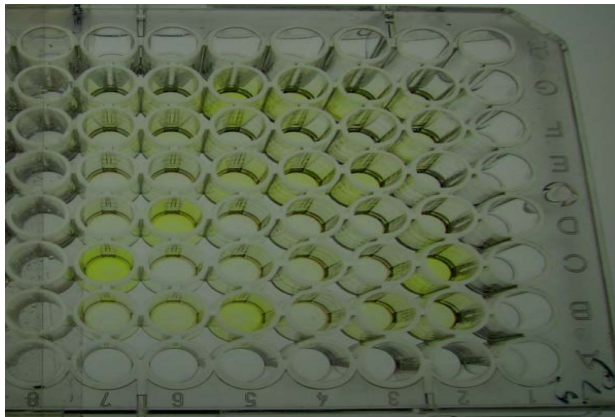
شکل ۲- نتایج ارزیابی بیماری PVY با تست الیزا در نتاج F 2

تجزیه نشانگرهای SSR با انجام الکتروفورز عمودی پس از رنگ آمیزی و ثبت ژل ها، اطلاعات به دست آمده برای هر جفت آغازگر با توجه به وجود و عدم وجود هر باند امتیاز دهی انجام شد. نتایج نشان داد که از بین ۱۰۰ جفت آغازگر مورد استفاده که فرآورده های PCR آنها، بر روی ژل پلی آکرلامید واسرشته ساز ۶ درصد الکتروفورز شده و ژل ها با محلول نیترات نقره رنگ آمیزی شدند، تنها ۲۸ جفت آغازگر SSR توانستند الگوی نواربندی متفاوتی را برای هر نشانگر در بین والدین مقاوم و حساس به PVY نشان دهند. (اسامی این نشانگرها و وزن آلل های آنها در جدول ۲ آورده شده است و در شکل ۱ الگوی چند