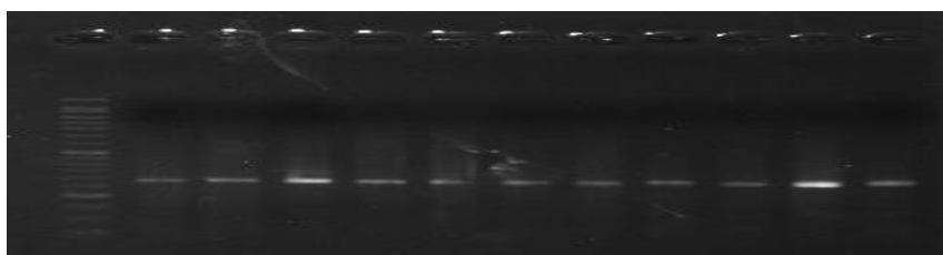
شکل ۱- الکتروفورز محصولات تکثیر شده ژن DRD1 در مرغان بومی آذربایجان غربی بر روی ژل آگارز ۱/۵ درصد

AG و GG به ترتیب با فراوانی ۰/۴۲، ۰/۴۹ و ۰/۰۹ در جمعیت حضور داشتند که الگوی AG با فراوانی ۰/۴۹ بیشترین مقدار فراوانی را در مقایسه با دیگر الگوها نشان داد (جدول ۱). پارامترهای مربوط به ژنتیک جمعیت و معیارهای مربوط به چندشکلی ژن DRD1 محاسبه و در جدول ۲ ارائه شده است. آزمون کای اسکوار نشان داد که جمعیت مورد مطالعه برای این جایگاه ژنی در تعادل هاردی واینبرگ قرار دارد که این امر می‌تواند به دلیل تعداد نسبتاً زیاد نمونه‌های مورد بررسی باشد. یکی از خصوصیات نشانگر مولکولی، تعداد آلل مؤثر است. در مرغان بومی آذربایجان غربی در جایگاه مورد مطالعه از ژن DRD1 تعداد آلل واقعی (Na) برابر دو و تعداد آلل مؤثر (Ne) ۱/۸۱ محاسبه شد که نزدیکی مقادیر این دو عدد به همدیگر می‌تواند نشان‌دهنده کارایی خوب آلل‌ها در ایجاد چندشکلی و تنوع ژنتیکی بالا باشد. برای مشخص کردن بهتر تنوع ژنتیکی از شاخص اطلاعاتی شانون استفاده شد که دامنه تغییرپذیری این شاخص بین صفر و یک قرار دارد و هر چه به صفر نزدیک‌تر شود، تنوع کمتر خواهد شد. در این پژوهش میزان شاخص شانون محاسبه شده برابر ۰/۶۴ بود که بیانگر تنوع ژنتیکی بالا در جایگاه‌های مورد بررسی در جمعیت است. کاته‌کولامین‌ها جزو هورمون‌های جنگ و گریز محسوب شده و از گره آدرنال آزاد می‌شوند. این مواد بخشی از سامانه عصبی سمپاتیک هستند و در پاسخ به استرس ترشح می‌شوند. این آمین‌ها به دلیل داشتن یک گروه کاتکولی (3,4-dihydroxybenzene) کاته‌کولامین نامیده