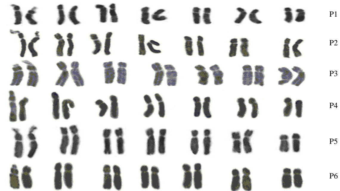
شکل ۲- کاریوگرام شش جمعیت مورد مطالعه از گونه P. fugax

نسبت بلندترین کروموزوم به کوتاهترین کروموزوم (R)، دامنه طول نسبی کروموزوم‌ها (DRL)، درصد فرم کلی کاربوتیپ (TF%)، شاخص تقارن استیبینز (ST)