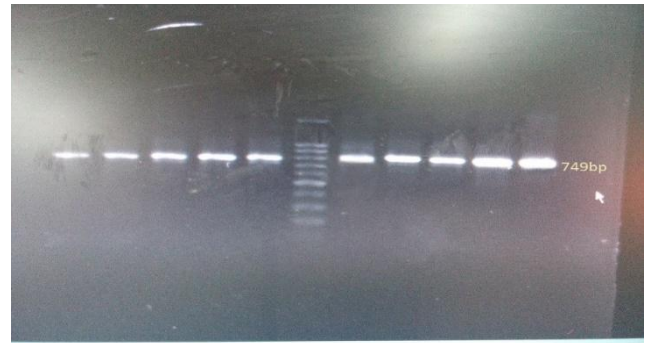
شکل ۲- تکثیر قطعه ۷۴۹ جفت‌بازی از ژنوم میتوکندری