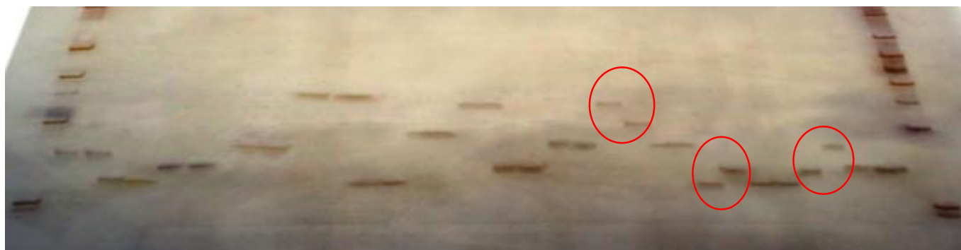
شکل ۴- الگوی نوار بندی متفاوت نشانگرهای دارای بیشترین چندشکلی بر روی بالک های مقاوم و حساس به (BR.PVY) بالک مقاوم و (BS) بالک حساس. نشانگرهای دارای چندشکلی با دایره مشخص شده‌اند.

بلاست برنج پیوستگی دارد، همچنین مشخص شد که یک ژن جدید غالب به نام ژن Xa33(t) مقاومت به بیماری بلاست را در کولتیبور Ba7 برنج ایجاد می‌کند (Yang et al. 2009). Shi et al. (2011)، با استفاده از روش MAS، از تعدادی نشانگرهای مولکولی مبتنی بر PCR برای شناسایی ژن مقاومت به ویروس لکه حلقوی گوجه فرنگی (TSWV)، ژن SW-5 استفاده کردند. در این تحقیق، یک نشانگر SNP اختصاصی برای ژن مقاومت به بیماری TSWV (ژن SW5-b ) در ژرم پلاسماهای مختلف گوجه فرنگی شناسایی شد (Shi et al. 2011). Ying et al. (2006)، با استفاده از روش MAS به بررسی و شناسایی نشانگرهای مولکولی برای مقاومت به بیماری زنگ برگ در گندم پرداختند. این نشانگرهای شناسایی شده می‌توانند برای اصلاح و بهبود مقاومت به این بیماری در برنامه‌های اصلاحی گندم از طریق روش MAS استفاده شوند (Ying et al. 2007). در پژوهشی، مکان یابی مولکولی ژن مقاومت به بیماری PVY (ژن Rysto ) در سیب زمینی بررسی شد. نتایج این پژوهش نشان داد که ژن Rysto یک ژن غالب است که مقاومت به بیماری PVY را در سیب زمینی ایجاد می‌کند (Brigenti et al. 1998). در تحقیقی که Rodal and Xiong (2008) انجام دادند، بیان کردند که توتون رقم VAM و رقم NC745 حامل ژن Va هستند که این ژن باعث ایجاد مقاومت توتون VAM نسبت به بیماری PVY می‌