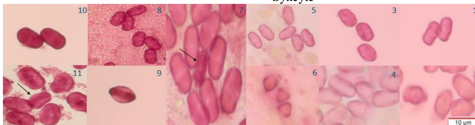
شکل ۳- دانه گرده در زیره سبز

۱ و ۲- به ترتیب دانه گرده نرمال و نابالغ در نمونه تحت تیمار آبیاری نرمال و ۰/۰۳ درصد نانوذره ۳ و ۴- به ترتیب دانه گرده نرمال و نابالغ در نمونه تحت تیمار تنش خشکی و ۰/۰۳ درصد نانوذره ۵ و ۶- به ترتیب دانه گرده نرمال و نابالغ در نمونه تحت تیمار ۰/۰۱۵ درصد نانوذره و آبیاری نرمال ۷- دانه گرده نابالغ (پیکان) در کنار دانه گرده نرمال تحت شرایط تیمار با نانوذره در غلظت ۰/۰۱۵ درصد و تنش خشکی ۸ و ۹- به ترتیب دانه گرده بالغ و نابالغ در نمونه شاهد ۱۰ و ۱۱- به ترتیب دانه گرده نرمال و نابالغ در نمونه تحت تنش خشکی.