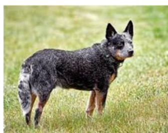
Australian Cattle Dog